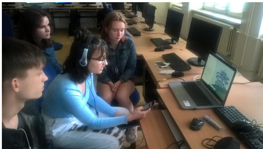
Obrázek 3 On-line mobilita

v jednotlivých zemích, sportovní názvosloví přejaté z angličtiny, příkladné osobnosti sportovního světa, a především na to, jak sporty a fyzická aktivita přispívají k vyššímu sebehodnocení a celkovému duševnímu i fyzickému zdraví