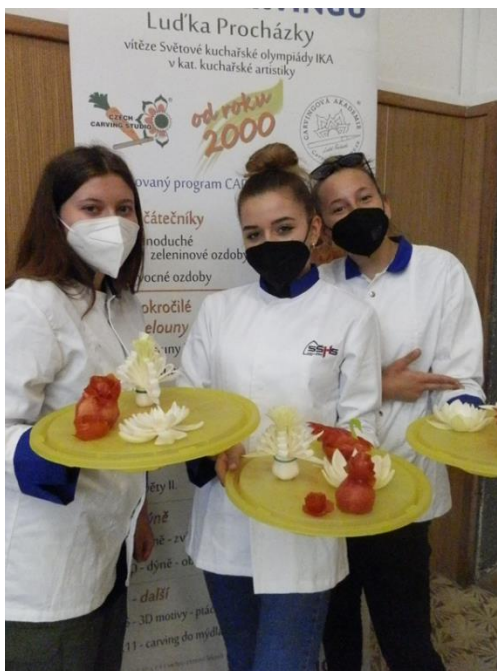
Obrázek 2 práce žáků