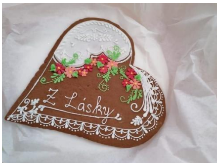
Obrázek práce žáků

Školní rok se překlopil do druhé půli a žáci i nadále zůstali doma, jsme na facebooku a instagramu školy vyhlásili online tvořivou valentýnskou soutěž, abychom studentům toto období distanční výuky zpestřili a motivovali je. Soutěž byla rozdělena do několika kategorií a zúčastnilo se jí skoro 70 studentů školy.