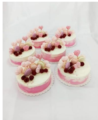
Obrázek práce žáků